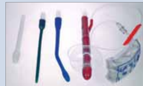
Verschillende canule's verkrijgbaar